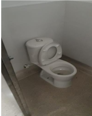
Fuente: Registro de visita de Obra- Elaboró: Irma López López, (Profesional Universitario)