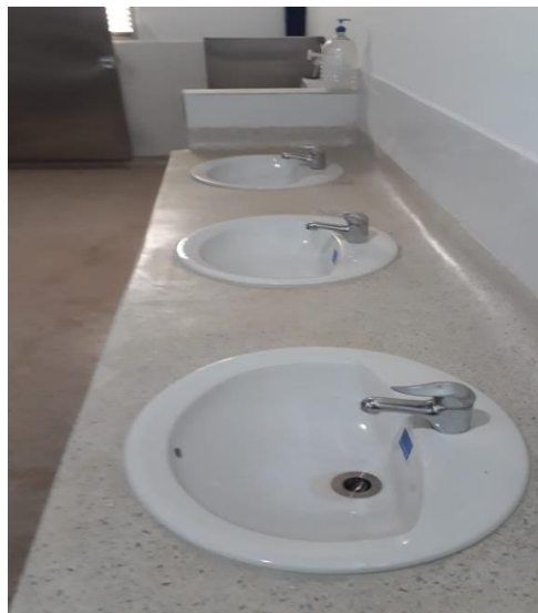
Fuente: Registro de visita de Obra- Elaboró: Irma López López, (Profesional Universitario)