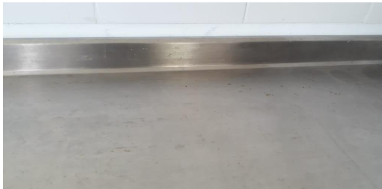
Fuente: Registro de visita de Obra- Elaboró: Irma López López, (Profesional Universitario)