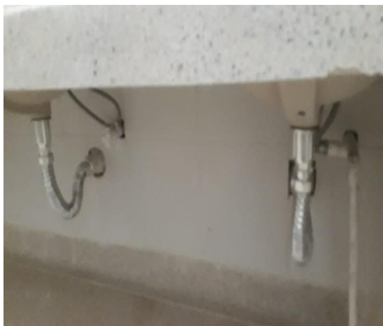
Fuente: Registro de visita de Obra- Elaboró: Irma López López, (Profesional Universitario)