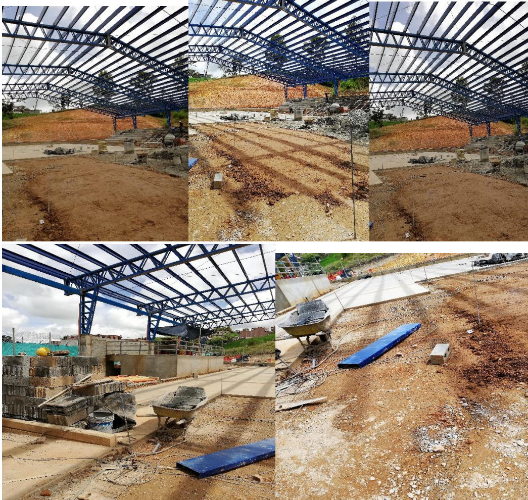
Fuente: Registro de visita de Obra- Pisos en concreto sin terminar y Cubierta sin instalar. Elaboró: Irma López López, (Profesional Universitario)

Lo anterior inobservando lo establecido en la cláusula séptima del contrato, Además, denota fallas en el proceso de supervisión del contrato; situación ésta que contraviene los procedimientos establecidos en los Artículos 83 y 84 de la Ley 1474 de 2011.